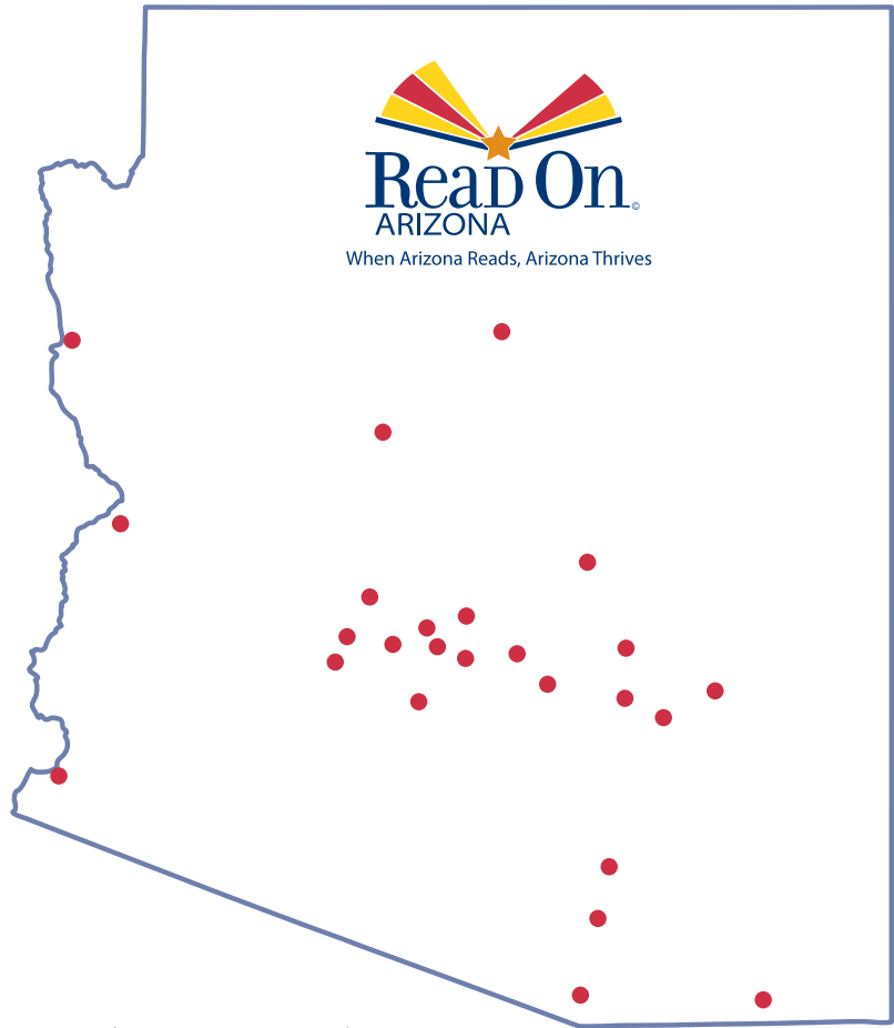
● = Read On Arizona community location

Para más información de los recursos locales por favor visite: ReadOnArizona.org